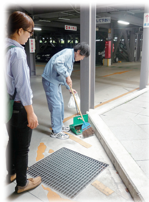
ジョブコーチによる支援風景