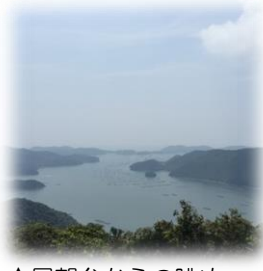
↑展望台からの眺め

8月のハイキングは備前市にある夕立受山に行きました。片上湾や日生諸島の眺めが素晴らしい山です。この日は大変天気もよく、時々吹き抜ける風が心地よい山行となりました。