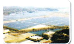
[瀬戸内kirei太陽光発電所]