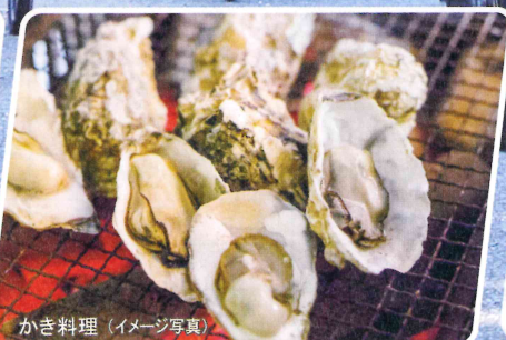
かき料理 (イメージ写真)