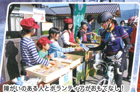
障がいのある人とボランティアがおもてなし!