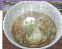
第12回 軽食部門 優勝 「具たくさんけんちん雑煮」

(AB-1コンテストエントリー品目以外の授産品も、物販(授産品販売)コーナーで販売します。)