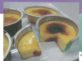
第12回 菓子部門 優勝 「苺クリームブリュレ」