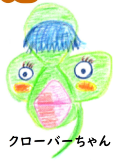
クローバーちゃん

心の病を経験したメンバーが、地域のみなさんとお茶やゆっくりお話をするなど、交流できる居場所づくりをはじめます。どなたでも参加できますので、お気軽にご参加ください。