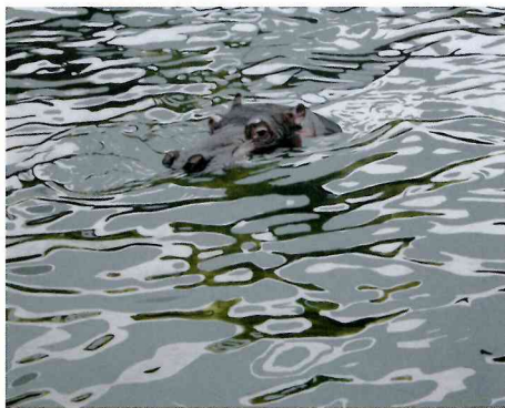
田中MAN「動くと動く。ゆるりと。」2009年