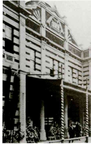
大正3年にオープンした映画館「金馬館」 「金馬館」の「金馬」は台湾での興行(曲馬団)で 大当たりした馬の名にちなんで名付けられた