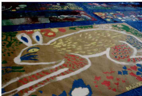
ワークショップ作品: tamaki iwao x 蓮昌寺保育園 2022年