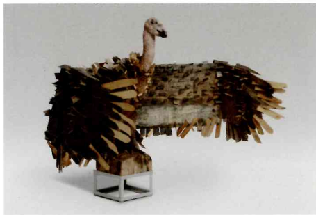
久山淑夫「コロナワールド戦風」2021年