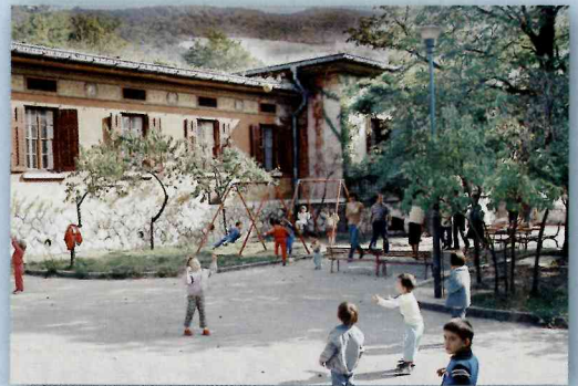
トリエステ・サンジョヴァンニ病院のかつての閉鎖病棟が、幼稚園になっていた(大熊が1986年初めてトリエステを訪れた時に撮影)

イベント URL の第三者への提供、ならびに本講演会の録音・録画・撮影は固くお断りいたします。