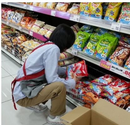
スーパーでの職場実習

◎働くためのプログラム（就労）：「働くこと」について、「知って（マナー講座など）」「見て、聞いて（見学）」「やってみて（体験）」等、就労への準備をしていくプログラムです。自信がついて、仕事への一歩を踏み出したいという方へは、求職活動支援・就労後のサポートも行います。