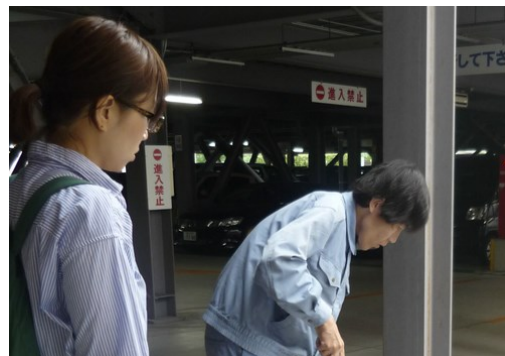
ジョブコーチ支援