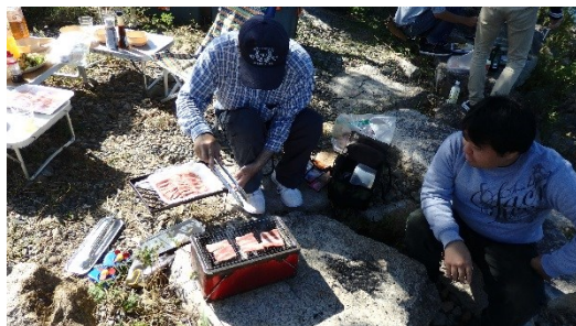
レクリエーション（バーベキュー）

◎ わくわくプログラム（動） ：ワクワクすることや、体を動かしてリフレッシュできる活動的なプログラムです。1人ではちょっと億劫だな...と思うことも、みんなとやれば「おもしろい！できた！」が待っています。集団の活動に慣れたい人、体験を通して出かけるきっかけを持ちたい人、とにかく一緒にやってみましょう！