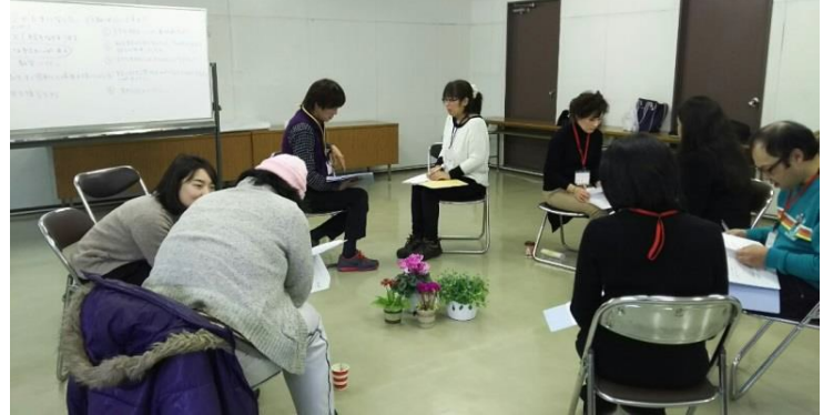
ピアサポーター講座

◎ 情報発信 ：情報誌「ぱる通信」を発行し、地域での暮らしに役立つ情報を提供しています。