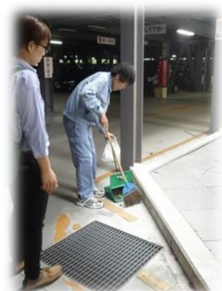
ジョブコーチによる支援風景

○就職後のフォローアップ 定期的な職場訪問 業務内容や勤務時間の調整 やむを得ず離職に至った後の 再就職支援など